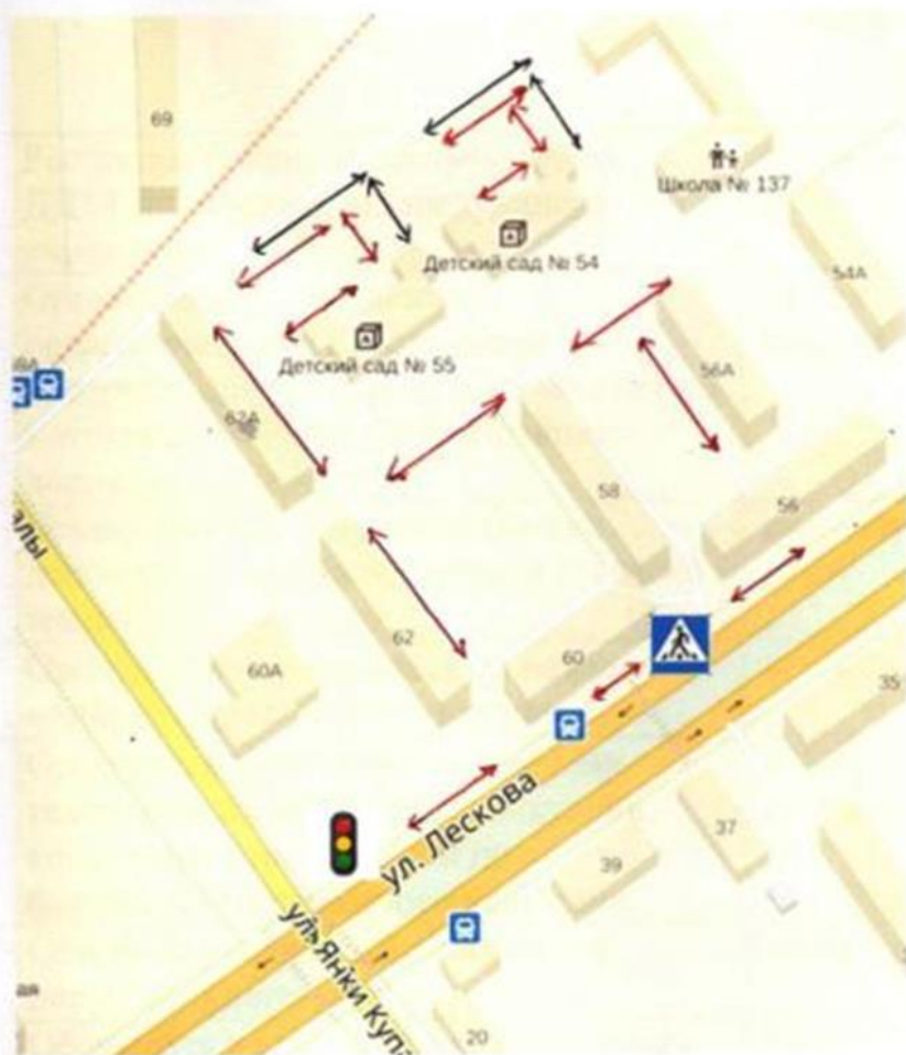
Схема организации дорожного движения: план-схема района расположения ДОО, пути движения воспитанников и транспортных средств.