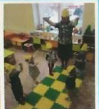
Утренняя зарядка. Утром солнышко встает Выше, выше, выше.