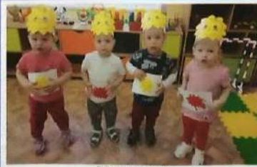
Работа с пластилином «Солнышко веселее, улыбочка веселее»