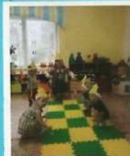
С ними солнышко заигает Ниже, выше, ниже.