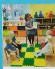
Читаем вместе про солнышко