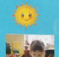
Знакомим с жестким пластилином.