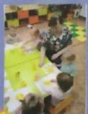
Играем с пластилином «Помоги солнышку набить пуговки»