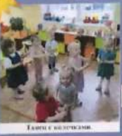
Играем с кубиками.