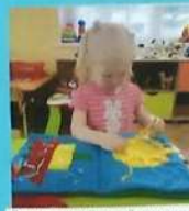
Рисование у детей ладоней материи рук.

Знакомим детей с объектом природы – солнцем и его влиянием на окружающий мир через организацию разных видов деятельности: игровой, познавательной, продуктивной.