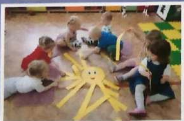
Играем с пластилином «Детишки и солнышко дружат»