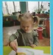
Рисование на тему «Пестрыми жемчужинами малякишко солнышко»