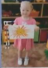
«Наситим солнышко» Рисование ладошками